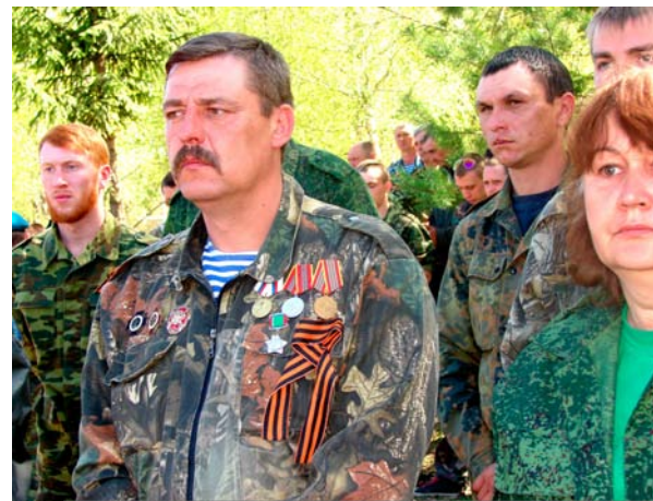
Поисковики продолжают Вахту Памяти - 2015